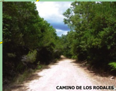
CAMINO DE LOS RODALES