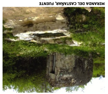
MIRANDA DEL CASTAÑAR, FUENTE

Iniciamos el camino frente al centro médico, recorriendo los primeros 700 m. para salir del núcleo del municipio, donde se disfruta de una espectacular vista de la villa medieval de Miranda del Castañar, el valle del río Francia y las panorámicas de la Sierra de Francia, destacando sobre ella, la Peña de Francia de 1723 m. de altitud, que nos acompañará durante un buen trecho como referencia paisajística de la comarca. Continuamos por la pista forestal entre robles, donde dejaremos a nuestra derecha el camping "El Burrito Blanco", seguimos, acompañados de robles con algún que otro viñedo, hasta una bifurcación de la pista donde cogemos la de la izquierda dejando a nuestra espalda la Sierra de Francia. Saliendo de los robles y tras una ligera subida, nos encontramos de frente con la espectacular vista de la Sierra de Béjar, pasando entre viñas llegamos a una segunda bifurcación de la pista, donde si seguimos por la izquierda iremos hacia Miranda y si continuamos recto por la variante, se llega, tras recorrer 300 m., al caño Cachope, donde una vez allí podremos refrescarnos antes de volver sobre nuestros pasos a la pista que nos lleva a Miranda, dejando a nuestro paso bosquesillos de madroños que en algunos casos forman pequeños rodallos; proseguimos hasta encontrarlos con otra bifurcación, donde giraremos a la izquierda y descendemos suavemente entre un espeso robleal sin salinos de la pista hasta desembocar en el colegio de Miranda del Castañar.