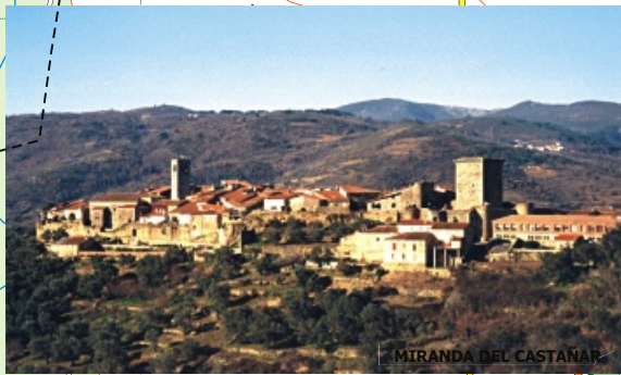
MIRANDA DEL CASTAÑAR